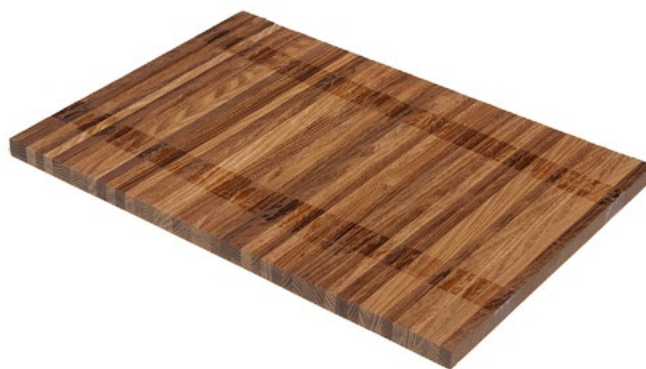
Thermory Kőrís (közepes)