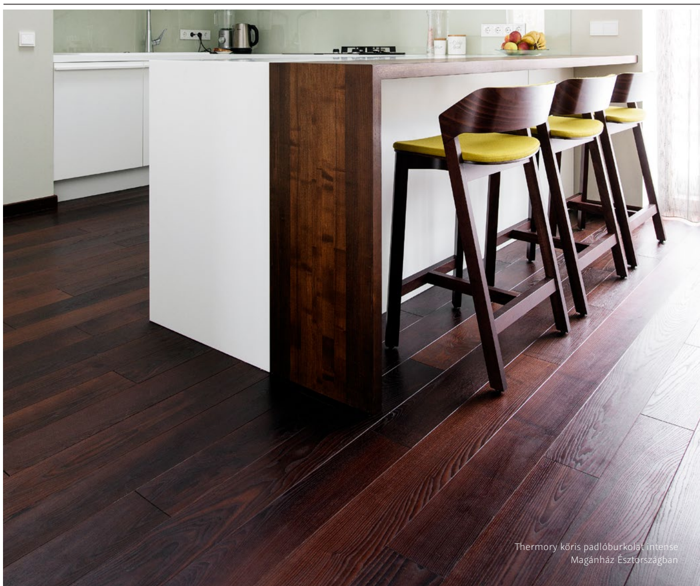
Thermory kőris padlóburkolat intense Magánház Észországban

FA ALJZAT: A megfelelő laminált aljzat stabil és szintben van. A burkoló lapot mindig az aljzathoz kell rögzíteni figyelembe véve a gyártó utasításait és a szoba szerkezetét.