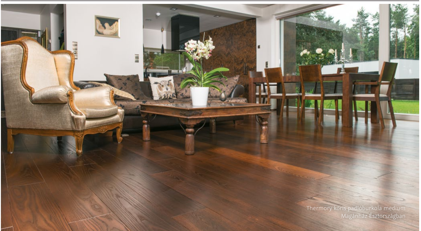
Thermory kőris padlóburkolat medium Magánház Észtsorszában

A padlóburkolat felszerelése: Mielőtt telepíteni a padlóburkolatot győződjön meg arról, hogy megfelelnek a standard követelményeknek. Kisebbsé eltérések a burkolatok külsején elfogadhatóak. Kérem vegye figyelembe, hogy a már beépített padlóburkolat esetében semmilyen reklamációt nem áll módunkban elfogadni. Precíz mérésekkel kezdje és tervezze meg a szoba elrendezését. Nagyon pontosnak és türelmesnek kell lennie, hogy az első sor padlóburkolatot abszolút egyenesen és hézag nélkül tudja lerakni – a többi burkolat helyes lefektetése ezen múlik. Használjon egy hosszú rudat és/vagy feszes vezetőt segítségként. A burkolat fektetési irányának a szoba bejáratától induljon és a természetes fény felé tartson. Ahhoz, hogy vizuálisan meg tudjuk nyújtani a szobát a burkolatoknak a szoba falával párhuzamosan kell futniuk. A lerakást mindig a hátsó fallal kezdje el. Az első burkolat hornyának mindig a fallal szemben kell lennie. Kezdeként a megfelelő távtartót helyezze el a fa és más fix tárgyak és a burkolat közé. A helyiség méretétől és formájától és a telepítési módszertől függően a hézag szélessége legalább 8 mm legyen. Az ék alakú távtartót a következő napon kell eltávolítani.