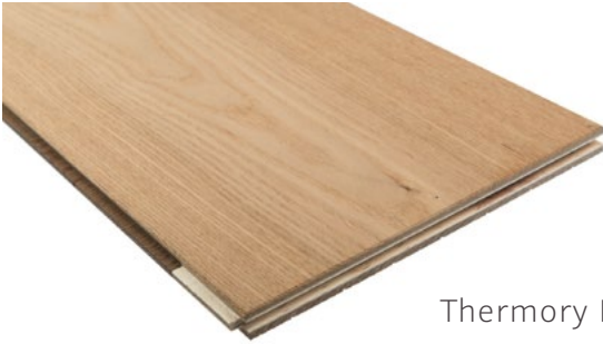
Thermory Kőris (közepes)

A Thermory® keményfa parketta időtlen szépséget és egyedülálló stílust kölcsönöz a beltéri tereknek, és növeli a magánház vagy a nyilvános terek értékét.