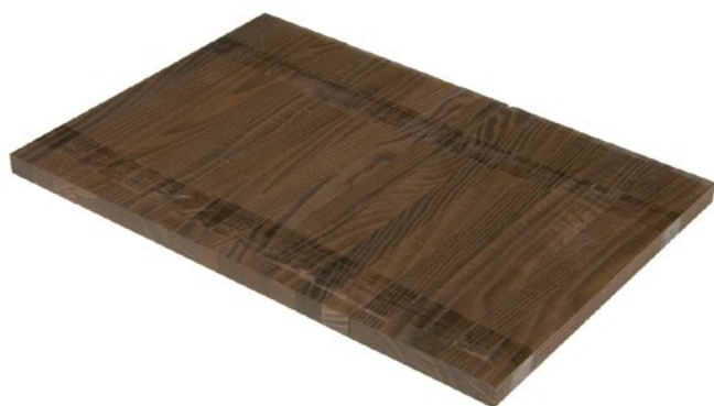
Thermory Kőrís (intenzív)